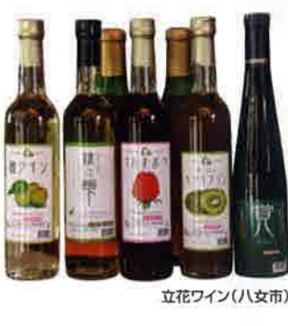
立花ワイン(八女市)